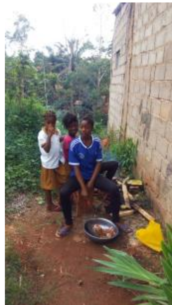
Orphelins Orphans Huérfanos 2